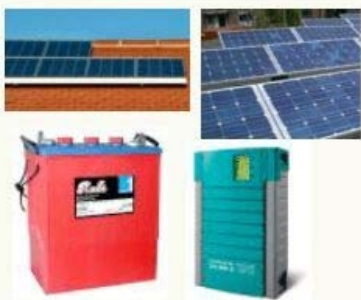
Kit Fotovoltaico Sustitución de combustibles Fósiles por Energías Renovables

Calculadores_Energéticos —Procesadores online, interactivos que facilitan los procedimientos complejos y los hacen accesibles y manejables.