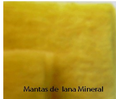
Mantas de lana Mineral

Pastas o Cementos . Los morteros y pastas aislantes, que se emplean en recubrir las paredes y sostener los ladrillos refractarios.